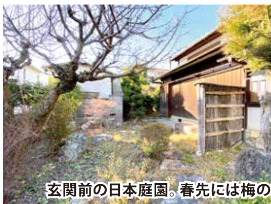
玄関前の日本庭園。春先には梅の開花が楽しめます

*自然災害による被害の軽減や防災対策に使用する目的で、被災想定区域や避難場所・避難経路などの防災関係施設の位置などを表示した地図。(国土交通省より)