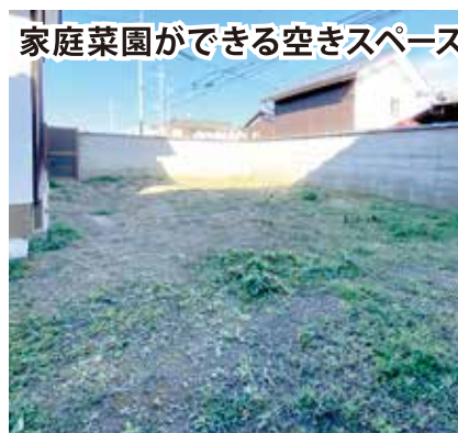
家庭菜園ができる空きスペース