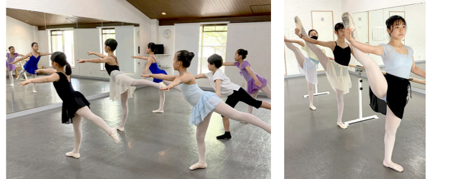
子どもクラスの様子。第2・第4土曜日にレッスンがあります。 【5歳から9歳】 10:00~11:00 【10歳から18歳】11:10~12:10 7月8月は無料体験を実施しています 詳しくはお問い合わせください。動きやすい格好で参加できます。

バレエを始められたのは17歳からと遅いスタート。周囲からは冷たい反応でしたが、反骨精神でレッスンに集中。ここまで頑張れたのは「これまで下を向いていた私が、身体を使った表現と出会い、人の心を動かせる世界があることに気が付き人生が明るく変わったから」。表現力を高めるためジャズダンスも研鑽し、努力が実を結んでバレエコンクールでは入賞。水を得た魚のように前進していきます。現在もシングルマザーとしてふたりの子どもを育てながら忙しい日々を送っています。