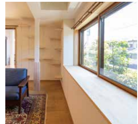
大きく広い出窓は猫の指定席。通りを歩き交う人を眺めたりステップを行ったり来たり。柱は板で囲んで爪からガードする工夫も。